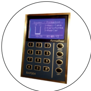
User friendly software