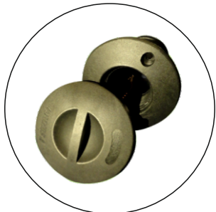
Screw filler cap